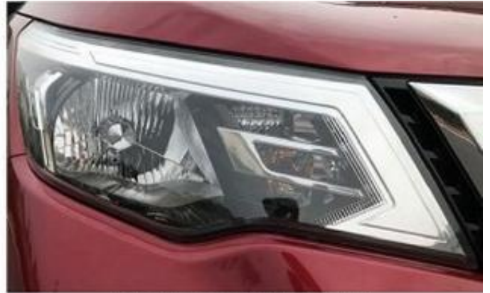
卤素前照灯（不装昼间行驶灯）