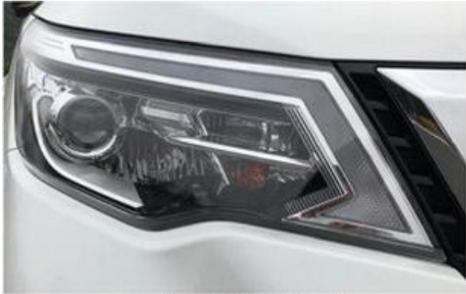
LED 前照灯（装有昼间行驶灯）